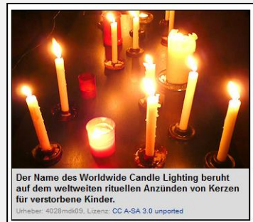
Der Name des Worldwide Candle Lighting beruht auf dem weltweiten rituellen Anzünden von Kerzen für verstorbene Kinder.

Quelle (Auszüge): " Worldwide Candle Lighting " und Homepage Verwaiste Eltern und Geschwister Hamburg e.V.