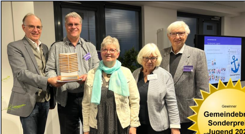
Bischof Meister überreicht Urkunde und Trophäe

Frohe Weihnachten und ein glückliches Jahr 2024!