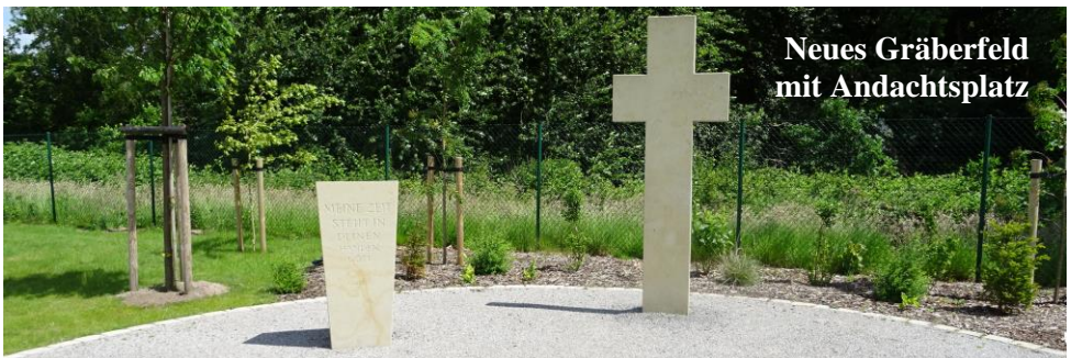
Neues Gräberfeld mit Andachtsplatz

Unsere haupt- und ehrenamtlichen MitarbeiterInnen werden in das Projekt miteinbezogen und können an Fortbildungen teilnehmen. Alle rechtlichen Vorgaben - auch die des Kirchenrechtes - werden eingehalten.