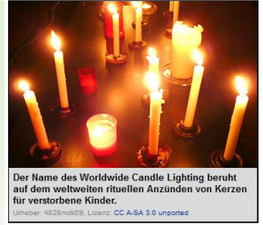
Der Name des Worldwide Candle Lighting beruht auf dem weltweiten rituellen Anzünden von Kerzen für verstorbene Kinder.

Quelle: " Worldwide Candle Lighting " oder www.kleiner-kalender.de